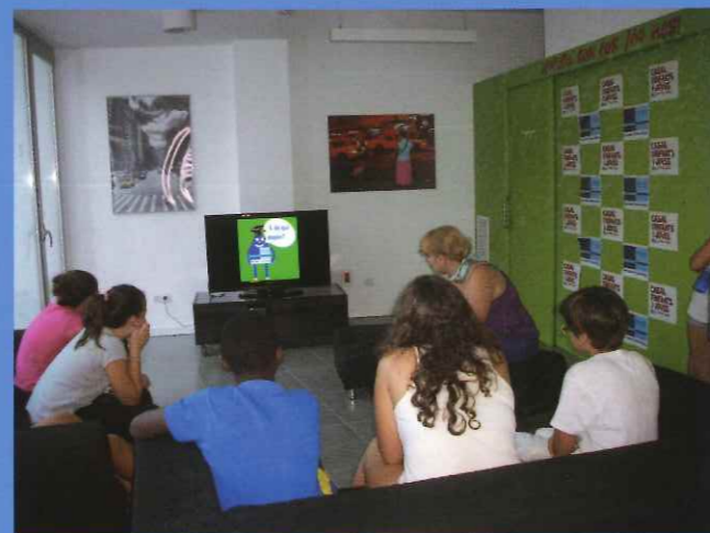
Actividades en Casal d'Infants i Joves