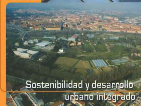
Sostenibilidad y desarrollo urbano integrado

Fondo Europeo de Desarrollo Regional Fondo de Cohesión