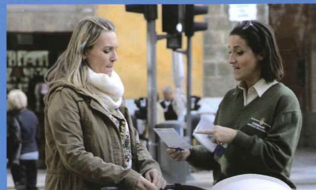
Información a la ciudadanía sobre la ejecución de obras cofinanciadas