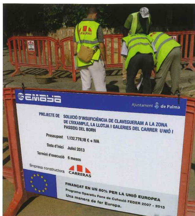
Obras en la zona de la Lonja

1. En aras de favorecer el desarrollo urbano sostenible, propiciando la regeneración y la rehabilitación de las zonas más desfavorecidas de las ciudades, la Unión Europea, a través del FEDER, ha invertido en numerosos municipios españoles por medio de la iniciativa Urbana. En concreto, en Palma de Mallorca se ha llevado a cabo la iniciativa Urbana Camp Redó, ¿cómo valora el papel de la cofinanciación del FEDER en esta actuación?