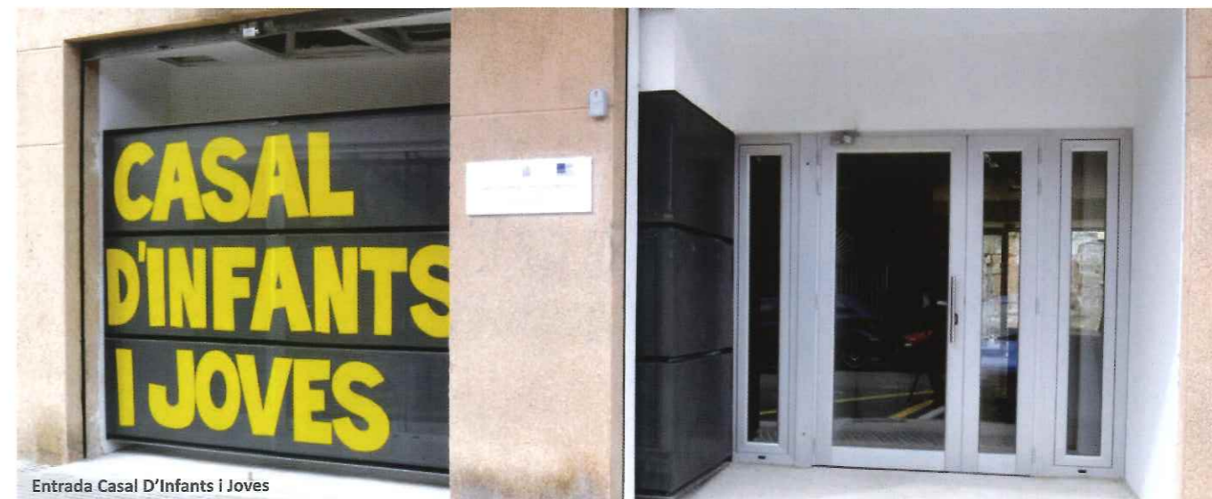
Entrada Casal D'Infants i Joves

En definitiva, la intervención del Consorci Riba, invirtiendo estos fondos europeos en este tipo de actuaciones, me ha parecido muy positiva. He visto cambios en los vecinos: mayor comunicación, menos conflictos y el barrio ha mejorado mucho físicamente.