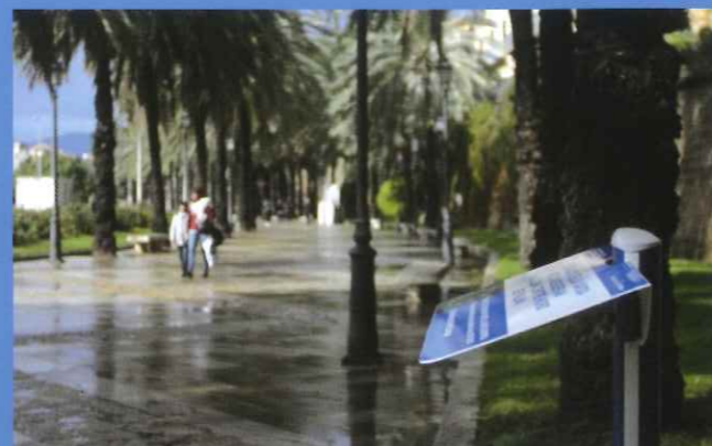
Operaciones en redes de alcantarillado

Además, no quiero dejar de decir, como Presidente de la Smartoffice, que uno de nuestros cometidos es canalizar las inversiones europeas dentro del horizonte 2020, con el objetivo de mejorar la estructura municipal y hacer de Palma una ciudad más inteligente y sostenible, para, de esta manera, continuar mejorando la calidad de vida de nuestros ciudadanos.